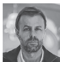
Vicepresidente: Germán Codina Powers Alcalde de Puente Alto