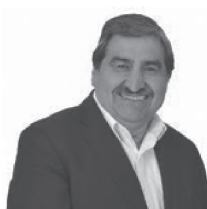
Vicepresidente: Sadi Melo Moya Alcalde de El Bosque