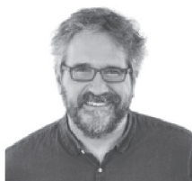
Primer Vicepresidente: Carlos Cuadrado Prats Alcalde de Huechuraba